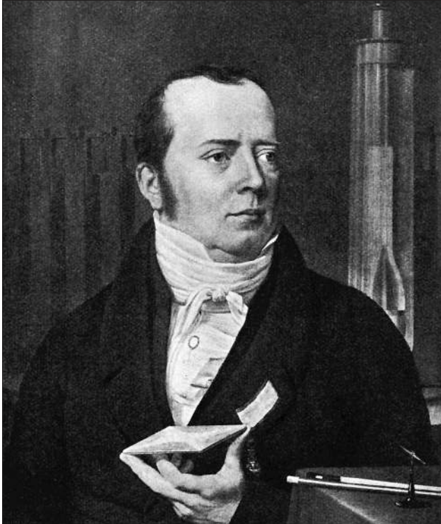
H. C. Ørsted. 1822. Efter Maleri af C. W. Eckersberg.

Ørsteds øvrige videnskabelige Bedrifter er ikke saa faa i Tal. Hans Arbejder over Klangfigurer, over Vædskers og